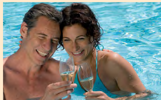
Den Augenblick genießen in der Wellnessoase beim Ringhotel Hohenlohe.

Sich einfach mal treiben lassen, Stress abbauen und an nichts denken, außer an das eigene Wohlbefinden – ein wohltemperiertes Bad in heilsamer Haller Sole ist da ein guter Anfang. In Zusammenarbeit mit unserem Partnerhotel Hohenlohe (3 km entfernt) und dem daran angegliederten Solebad können wir für Sie weitere Anwendungen organisieren, die Sie von Kopf bis Fuß verwöhnen: Gesichtsbehandlungen, Maniküre, Pediküre, Ganzkörperpackungen auf der Schwebeliege, Physiotherapie, Osteopathie, Klangtherapie, Hawaii- oder Ayurveda-Massagen u.v.m.