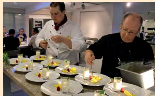
Einladung zur Küchenparty: Sie feiern, wir kümmern uns um den Rest.