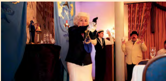
DinnerKrimi auf die „feine englische Art“: „Murder on Board, Mylord!“ – exklusiv buchbar für Gesellschaften ab 30 Pers.

Bühnenreife Erfolgsrezepte für Weihnachts- und Betriebsfeiern, Jubiläen, Geburtstagsfeste oder als fröhlicher Abschluss einer erfolgreichen Tagung.