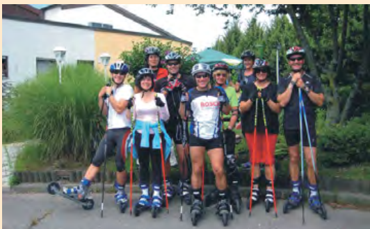
Skiken: eine Art Langlauf auf Rädern.