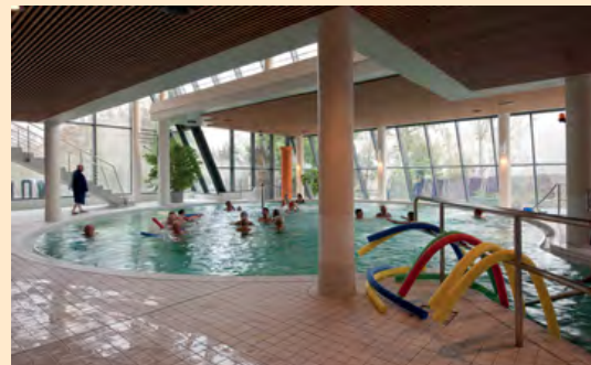
Entspannung im Solebad.

Jede Menge Geschichte, Kunst & Kultur und eine der schönsten Wellness-Oasen der Region – das Solebad im Ringhotel Hohenlohe – mit erweitertem Beauty- und Massageangebot, Klangentspannung und den Salzgrotten warten auf Sie.