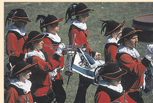
Kuchen- und Brunnenfest der Haller Salzsieder.