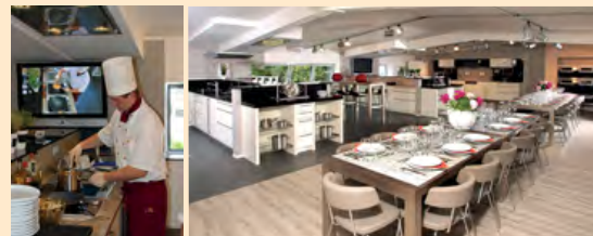
Rent a kitchen: die HEM-KochBar bietet Platz für bis zu 50 Pers.

Vier komplett ausgestattete Trendküchen, ausgerüstet u.a. mit Tepaniaki-Grill, Dampfgarer und Induktion, Chef's Table bis 30 Gäste, Kamera & TV, Cocktailbar, Loungeecken, WLAN und viel Platz für offene Kurse und geschlossene Gruppen.