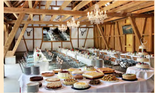
Noch mehr Raum zum Feiern: die Event-Scheune im Krone-Park.

* Preise bleiben konstant, auch wenn einzelne Leistungen nicht in Anspruch genommen werden.