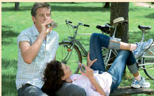
Hohenlohe ist ein echtes Radlerparadies.