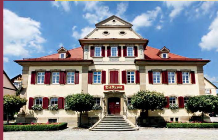
Das Stammhaus der KRONE.

Airport: Stuttgart (80 km); „Adolf Würth Airport“ Schwäbisch Hall-Hesselental (2 km).