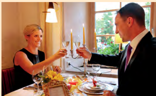
Ein „Herz“ für Verliebte ...