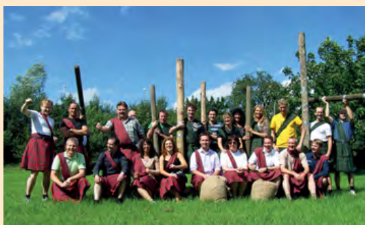
Highland-Games im Krone Park.

Unternehmungslustig? Wenn Sie gemeinsam mit Freunden, mit (Vereins-)Kollegen oder Kunden etwas Besonderes erleben wollen, sind Sie bei uns richtig.