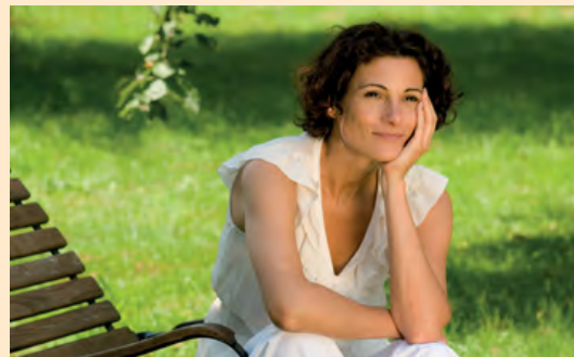
Einfach mal die Seele baumeln lassen – das haben Sie sich verdient!.

Wer samstags auf den Beinen ist, kann sonntags ruhig mal andere laufen lassen!