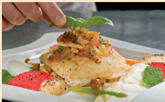
Es ist angerichtet – in der HEM-KochBar!

Sie wollten schon immer mal in einer richtig tollen, modernen Küche den Kochlöffel schwingen, die neueste Küchentechnik testen, Profiköchen über die Schultern schauen, mit Kollegen im Team kochen oder einfach eine Party in der Küche feiern? Unsere Angebote: