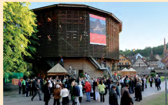
Das Globe Theater zählte 14.563 Besucher im letzten Jahr.

Nach dem Vorbild des mittelalterlichen Shakespeare-Theaters in London entstand im Jahr 2000 mitten im Haller Stadtpark auf der Kocherinsel „Unterwöhrd“ das „Haller Globe Theater“ mit 550 überdachten Sitzplätzen. Es wurde im Jahr 2000 anlässlich des 75-jährigen Jubiläums der Haller Freilichtspiele von Haller Holzhandwerkern erbaut und wird seit 2008 auch als Spielstätte für das Kindertheater genutzt.