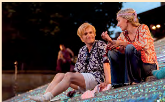
„The Summer of Love“, die umjubelte Erfolgsrevue 2011

Theater und Kultur auf der größten Kirchentreppe Europas, auf Straßen, Plätzen, in der Museumsscheune und im Theaterkeller. Gerne senden wir Ihnen das ausführliche Festspielprogramm zu.