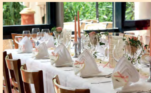
Festtafel im Gartenrestaurant